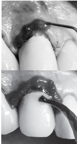
Мал.1 Захисний шар бар'єру EtchArrest наноситься на м'які тканини, що прилягають до поверхні, яку підлягає обробці.